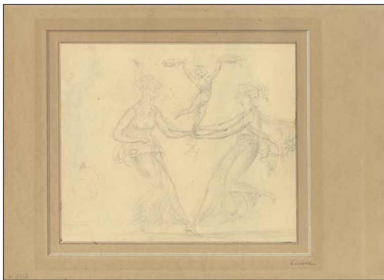
Antonio Canova, Danzatrici con amorino, foglio 38 verso.

Oggi, a distanza di quarant’anni da quell’evento, si evidenziano sostanziali problemi conservativi che impongono un adeguato intervento di restauro sull’intero complesso grafico. Le condizioni dei disegni variano molto da esemplare a esemplare. Si passa da semplici interventi manutentivi a delicate operazioni di ripristino per i fogli corrosi dall’inchiostro ferro-gallico. Inoltre nella maggior parte dei casi sarà necessario provvedere alla deacidificazione delle pagine di supporto su cui sono montati i disegni originali. Infine è prevista la sostituzione di tutti i vecchi passe-partout, ormai compromessi dal tempo.