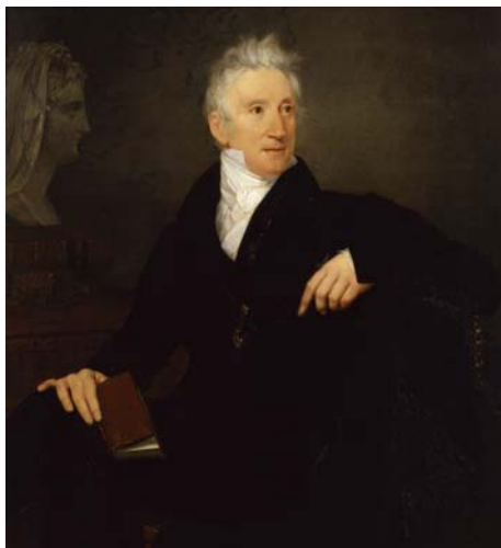
Ludovico Lipparini, Ritratto di Leopoldo Cicognara, Venezia, Gallerie dell'Accademia.

responsabile Gabinetto dei disegni e delle stampe del Museo Correr