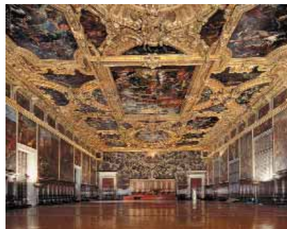
La Sala del Maggior Consiglio.

spazi in campiture definite dal disegno delle cornici con tutta probabilità precede (e, quindi, determina) la stessa stesura dei programmi iconografici. Cioè: potrebbero non essere le cornici con le loro dimensioni e sagome a essere con-