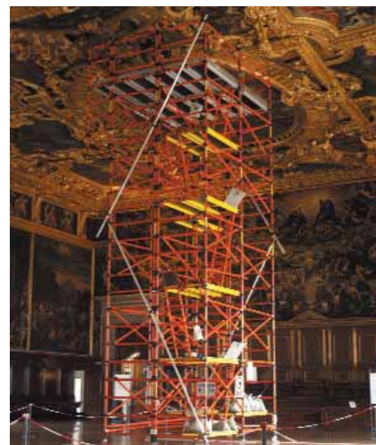
Il ponteggio per i restauri delle dorature.

umidità provocata da infiltrazioni d'acqua avvenute nel tempo di cui si distinguono tracce e, in ultima analisi, la tecnica di esecuzione del rivestimento dorato dove la gessatura costituisce una prepara-