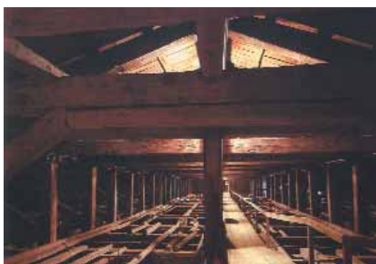
Il sottotetto della Sala del Maggior Consiglio.

L'impegno di ingegneria e carpenteria per dare solidità all'insieme, perché la funzione di sospensione delle tele avvenisse in sicurezza e perché fosse possibile l'ispezione e la manutenzione dal-