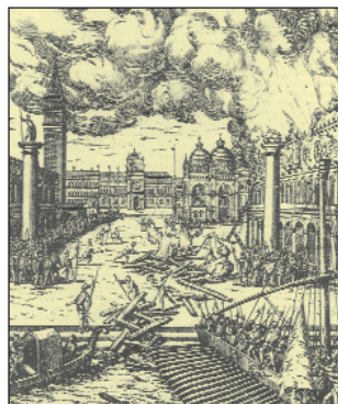
L'incendio di Palazzo Ducale del 1577 in un disegno di Höfnagel.

della Scuola Grande di San Rocco): si provvede, infatti, a far progettare e commissionare l'esecuzione della partitura lignea del soffitto secondo un disegno che divideva lo spazio in figure semplici e composite di differente dimensione e forma: quadrati, rettangoli, ovati, mezze lune, forme angolari concave e convesse e così via. La parte lignea – cioè la cornice vera e propria – si dispiega lungo assi sostanzialmente regolari ma le