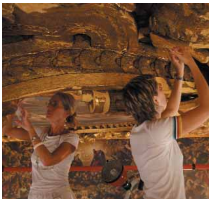
Le restauratrici al lavoro.

Per permettere una maggiore penetrazione del materiale consolidante, queste sono sempre precedute da microinfiltrazioni di acqua e alcool (1:1). Queste operazioni avvengono con la protezione di una velinatura con carta