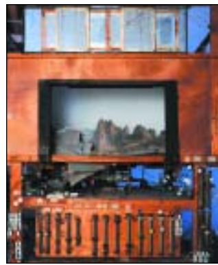
Scenografia e impianto luci.

In una rara memoria autobiografica Fortuny afferma: "Tutto quello che vidi e sentii mi accese nel desiderio di realizzare nuove forme e nuovi aspetti per accrescere gli effetti generali del teatro: ricordo ancora qualche particolare della scena dell' Oro del Reno che scontentava la mia fantasia giovanile. L'effetto del fiume in lontananza mancava di efficacia per un gioco di luce non bella".