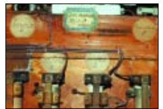
Particolari dell'apparato illuminotecnico e, in basso, dettaglio delle sedie.

minosi proiettati sulla scena di questo imponente modello teatrale costruito in ogni dettaglio dalle abili mani di Mariano Fortuny.