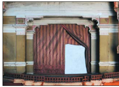
Il boccascena e, in basso, la cupola.

conservato nell'atelier, che ricostruisce pianta e alzati della scena del teatro tedesco di Bayreuth. Qui sono inoltre visibili in scala ridotta alcune applica-